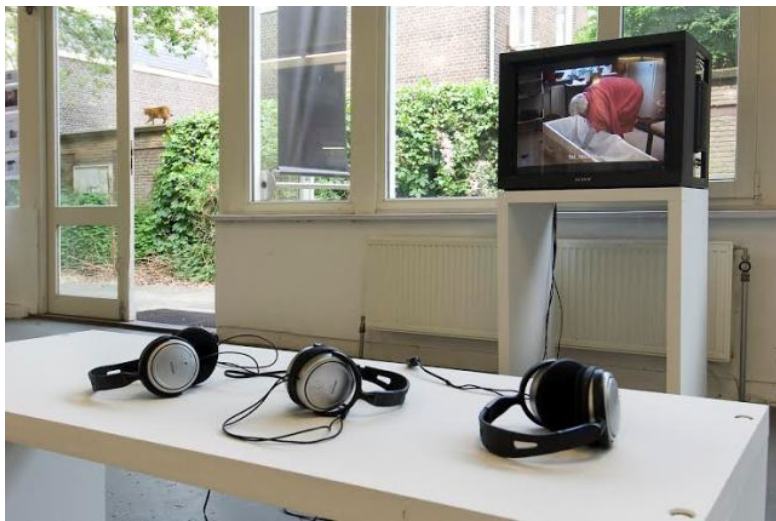
Niels Albers

De dood krijgt ineens een actievere plaats in het leven doordat er als het ware een voorbereiding op wordt gemaakt wat voor mij als kijker confronterend en ontroerend tegelijk is. Ik houd mij liever zo min mogelijk bezig met het onomstotelijke feit dat niet alleen ik zelf maar ook de mensen om wie ik geef op een dag zullen sterven. Het zien van deze doodskist die onderdeel is geworden van het leven brengt de dood ergens dichterbij, er ontstaat een relatie met een object dat uiteindelijk zal dienen als laatste 'vervoermiddel' naar het einde van een bestaan en het einde van dit kunstproject. De video maakt de functie van de kist duidelijk: op een dag zal de oma van Albers in deze kist komen te liggen. Het zien van de kist als object in de ruimte van de tentoonstelling met bezoekers die met een glas in de hand er even naar kijken en erbij staan te babbelen maakt het onderwerp ineens een stuk abstracter en minder intiem. Het is dan makkelijk om niet stil te staan bij de betekenis ervan en dit beeld illustreert wellicht tegelijk hoe mensen zich kunnen verhouden tot dit beladen onderwerp.